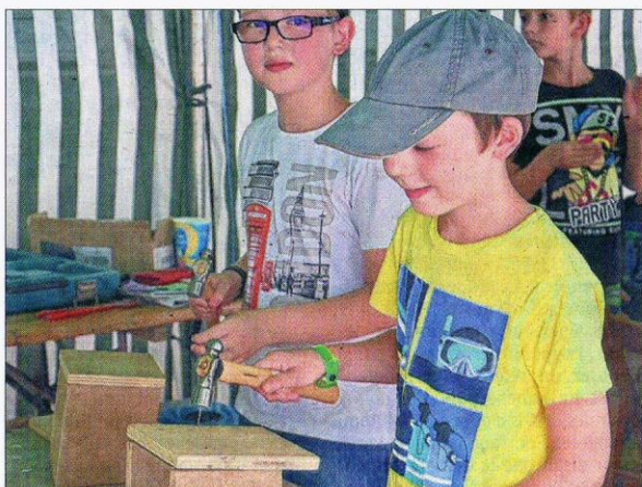
Sur le stand d'Axolitarité, les enfants dès 8 ans peuvent fabriquer une niche à oiseaux.