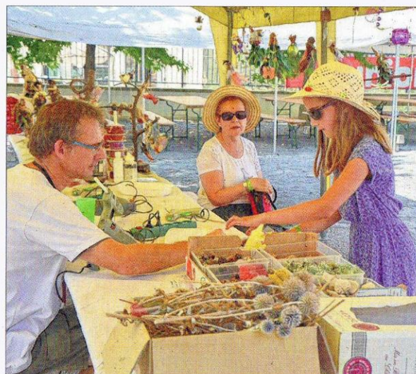
Fabrication de lutins à partir de pommes de pins, plumes et autres trésors de la nature.

Pour plus de photos connectez-vous à notre site internet