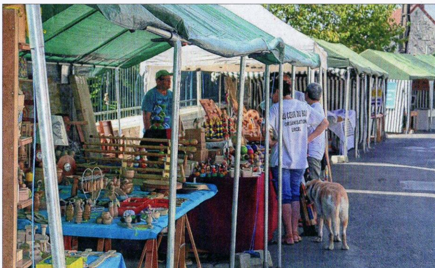
Sur la longue allée principale, les artisans proposent des jeux, de la vaisselle et des objets de décoration travaillés dans le bois.